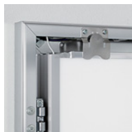
クリップ金具付き