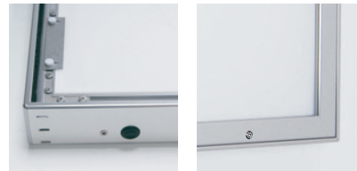
コードは付いておりません