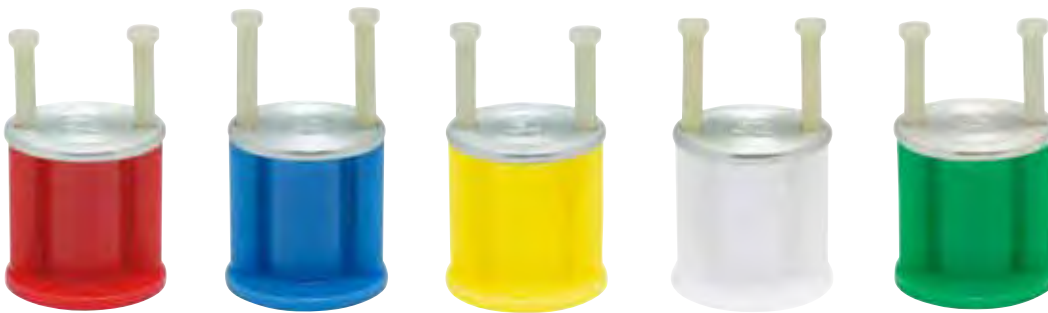
品番表 コードNo.M10052 ツインカット ※引抜試験値は破壊時の数値です

※重量物を吊設される場合は、 [カラーストロング] 樹脂釘タイプ (→ 20 ページ参照) [ドラゴン] 樹脂釘タイプ (→ 22 ページ参照) [カラーホール] 釘処理不要タイプ (→ 17 ページ参照) を ご使用下さい。