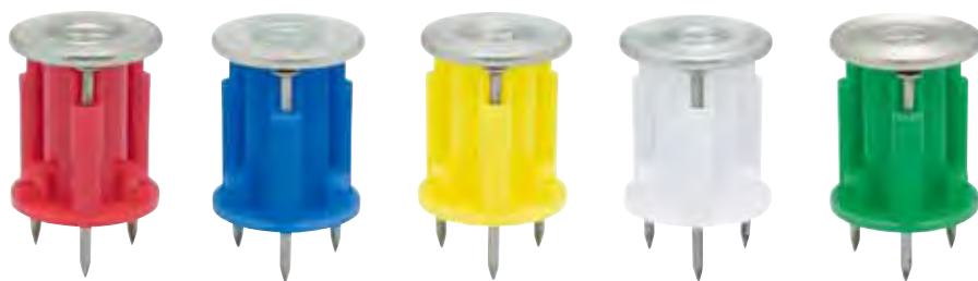
品番表 コードNo.M10046 ニューアポロ ※引抜試験値は破壊時の数値です

※釘処理が必要な場合は、 [ツインカット] 樹脂釘一体化タイプ (→ 18 ページ参照) [バリアス] 釘抜タイプ (→ 14 ページ参照) [ライトホール] 釘処理不要タイプ (→ 16 ページ参照) をご使用下さい。