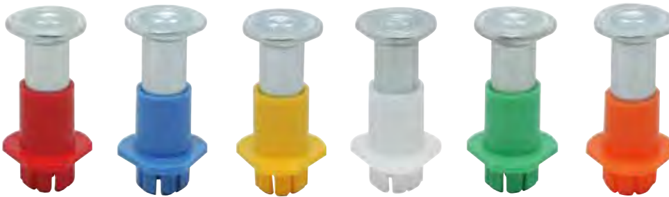
品番表 コードNo.M10064 デッキパンチ ※引抜試験値は破壊時の数値です