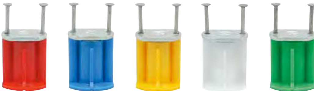
品番表 コードNo.M10044 アポロ-L ※引抜試験値は破壊時の数値です